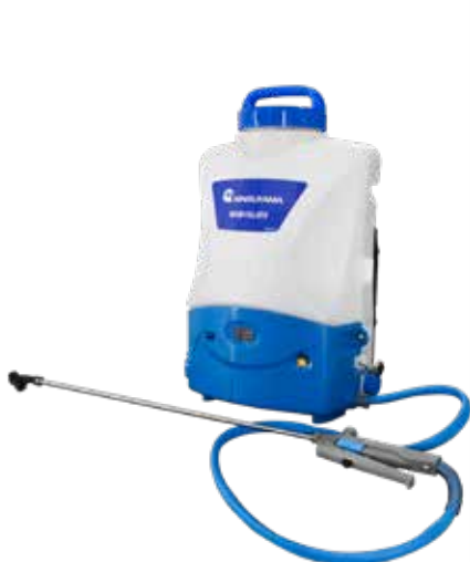
MSB 15 LI

Qu'il s'agisse de pulvérisation ou d'arrosage - l'application de liquides fait partie de la compétence principale de Maruyama. Ils conviennent par un excellent équilibre et une pression de service constante. C'est pourquoi les pulvérisateurs et atomiseurs de Maruyama sont idéaux pour les travaux agricoles, de jardinage et de lutte contre les parasites.