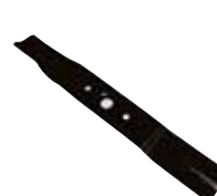
Couteau pour herbe mouillée (53cm)