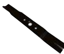
Couteau pour herbe mouillée (48cm)