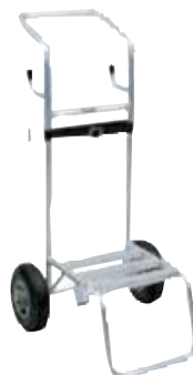
Chariot de transport