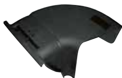
Kit d'éjection latérale