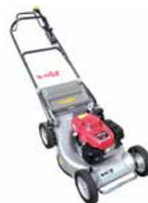
LM 4860 KOX